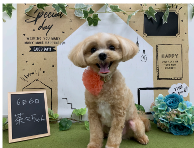
☆茶々ちゃん☆ 笑顔がステキなマルプーちゃん。 カメラ目線がキマってます！