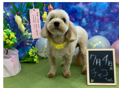
☆チャコちゃん☆ 人なつっこいマルプーちゃん。 とってもおりこうさん♪