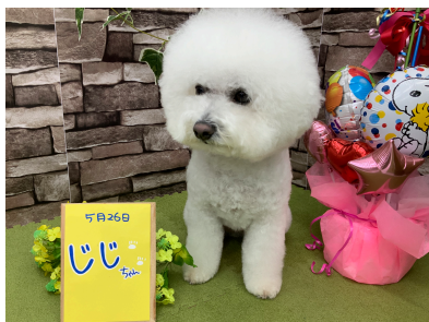
☆じじちゃん☆ みんな大好き！ フワフワかわいいビションさん。