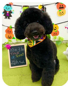
☆福丸ちゃん☆ とってもお利口さんです♪