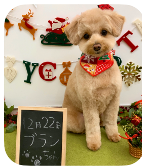
☆ブランちゃん☆ モフモフでとても可愛いです！