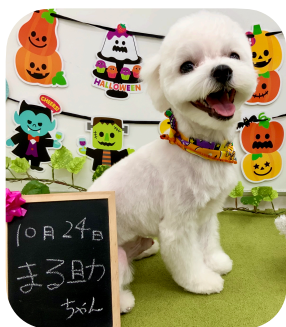
☆まる助ちゃん☆ パピー風カットがお似合いです！